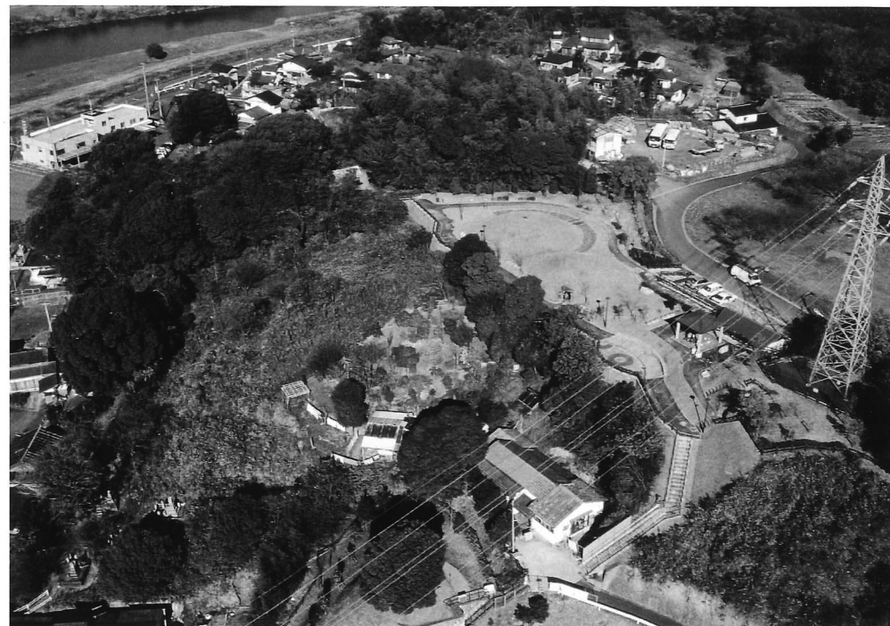
川島古墳公園全景