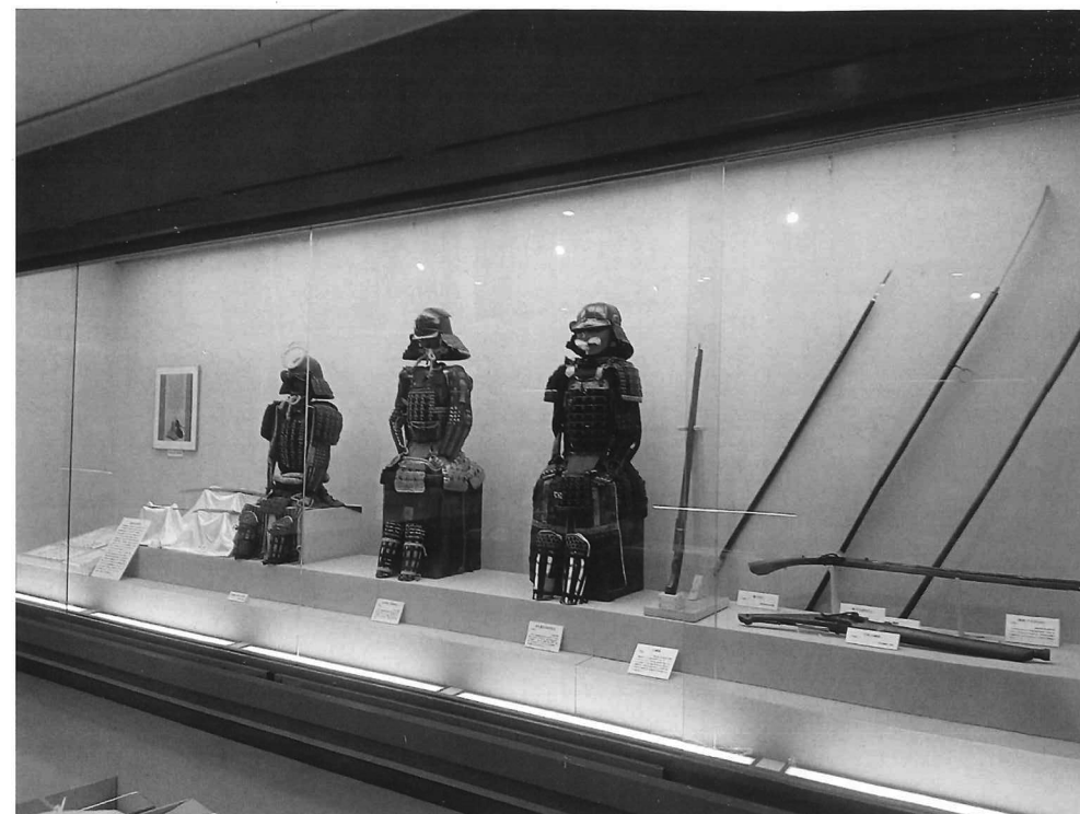
四季のまつりと端午の節句展会場