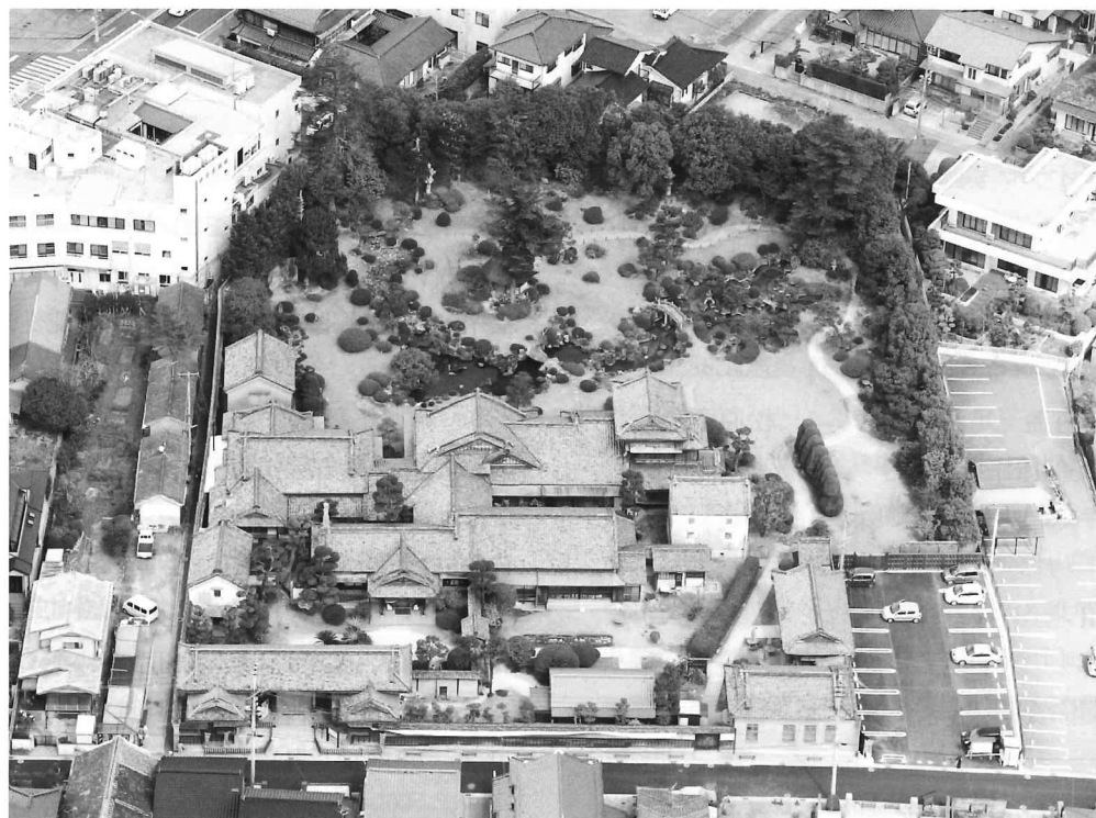
旧伊藤伝右衛門邸全景