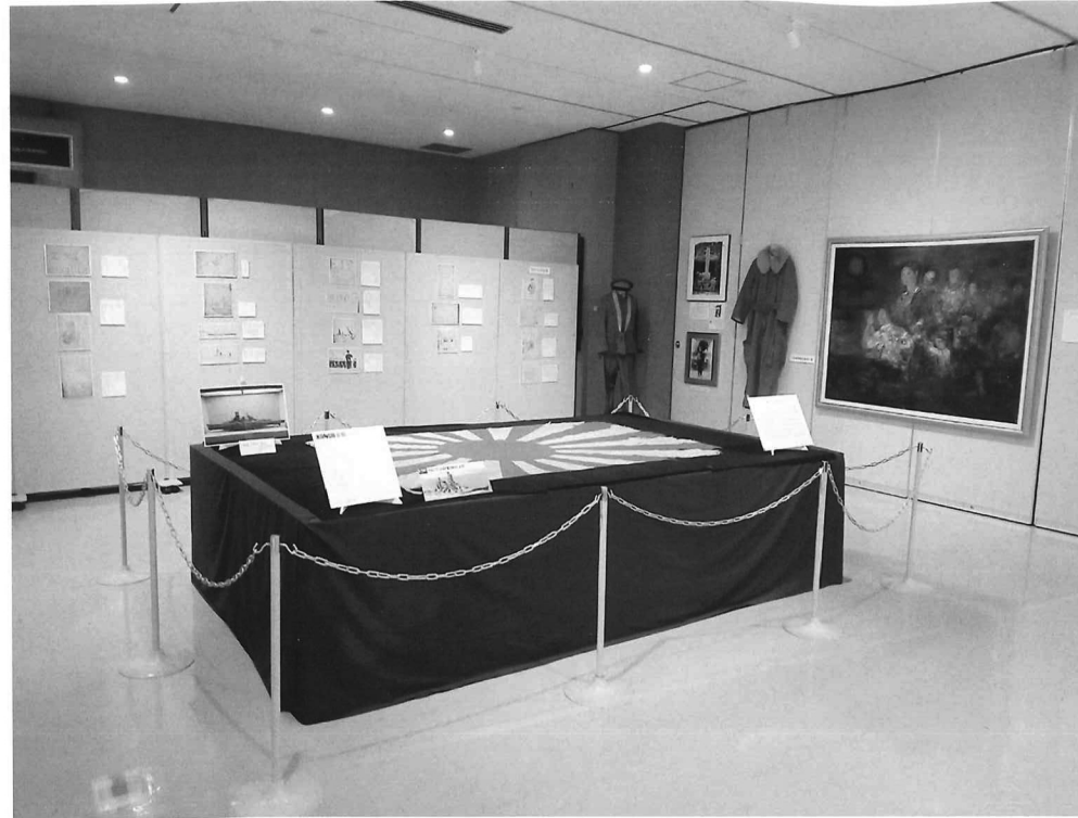
戦争とわたしたちの暮らし展会場