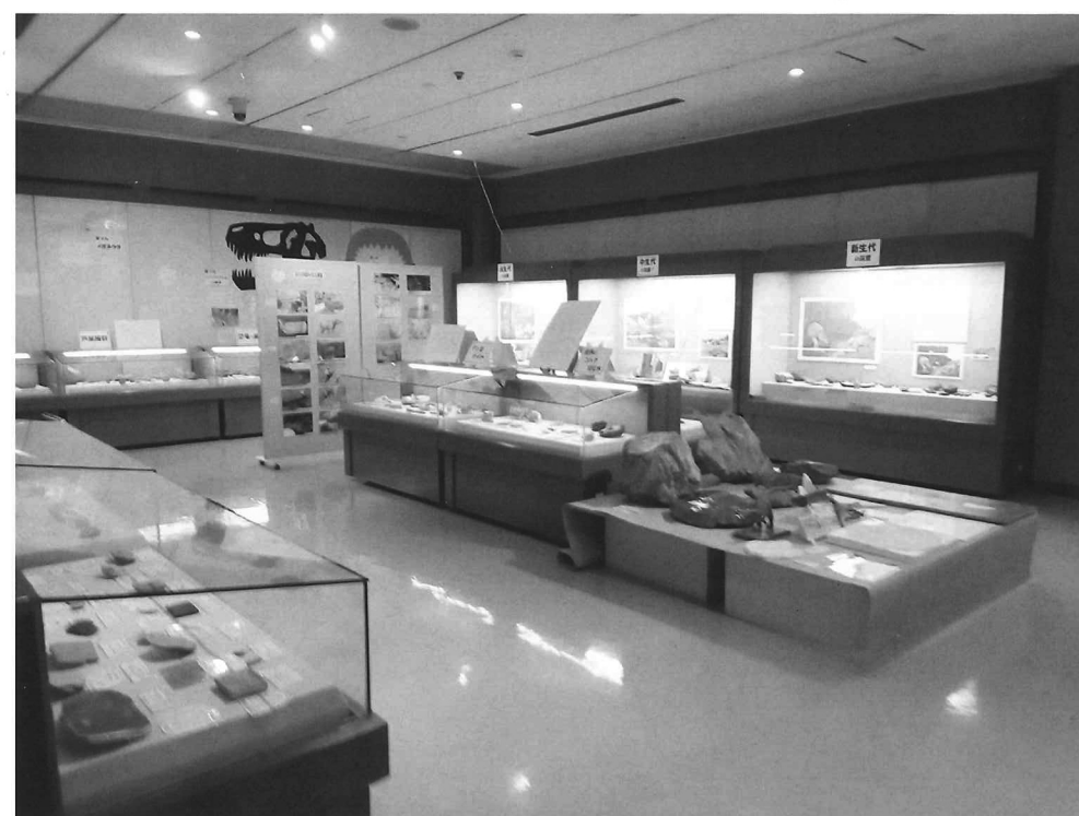
実はすごい！筑豊の化石展会場