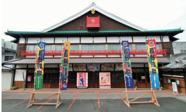
令和8年10月開場予定

●飯塚市筑穂トレーニングルーム条例 筑穂トレーニングルーム新設(筑穂庁舎4階)に伴い、筑穂トレーニングルームに関する趣旨、設置目的及び使用料金等について規定するものです。