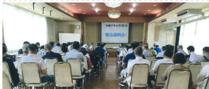
（筑穂交流センター中研修室での緊急説明会）