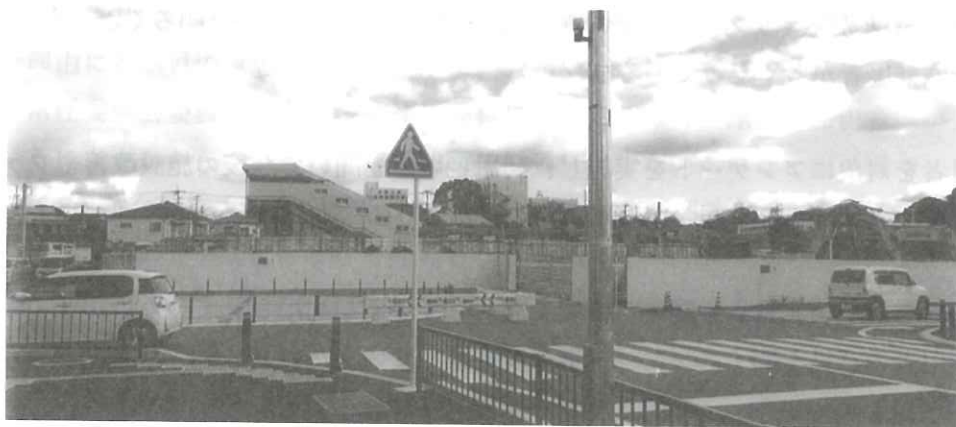
工事中の飯塚駅西側駅前広場から駅舎を望む

城ヶ崎踏切の改良工事については、令和6年度に実施設計委託が完了し、令和6年度・7年度で用地購入を進めており、来年、令和8年度の工事を予定しています。