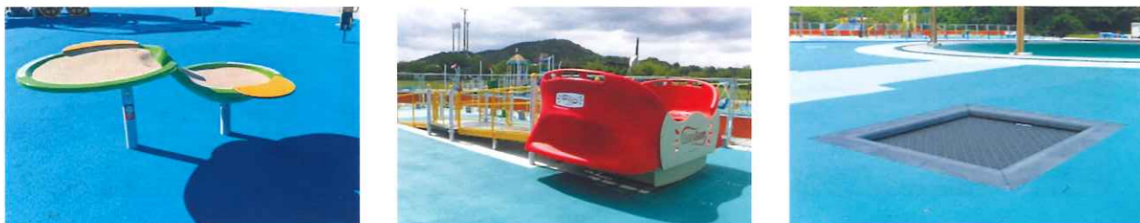
▲ 左から車いすに乗ったまま利用できる「砂場」、「ゆれる遊具」、「トランポリン」