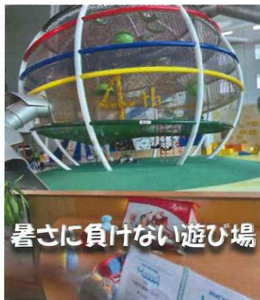
暑さに負けない遊び場