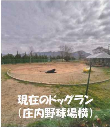
現在のドッグラン (庄内野球場横)