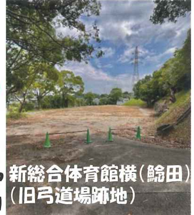
新総合体育館横(鯉田) (旧弓道場跡地)