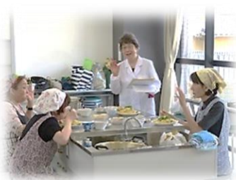
わいわい楽しい料理教室です♪ 作った料理は試食していただけます。