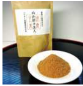
(株)エコライフ福岡