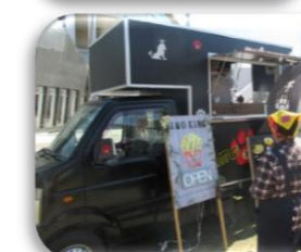
キッチンカーも大人気