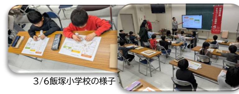
3/6飯塚小学校の様子

【桜の花びらメッセージ】飯塚第一中学校・飯塚小学校・片島小学校、3月の卒業式、4月の入学式のために自治会長をはじめ、地域の皆さまが桜の花びらにお祝いの言葉を書いていただき立派な桜の木が完成しました。