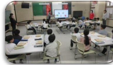
2/18片島小学校の様子

【プログラミング教室(ピース)】2月18日(水)片島小学校1年生・3月6日(金)飯塚小学校1年生を対象に、プログラミング教室(ピース)の体験授業を行いました。