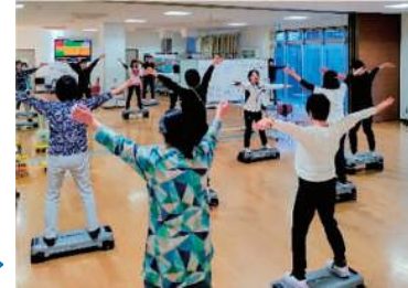
個別運動プログラム教室参加者の様子