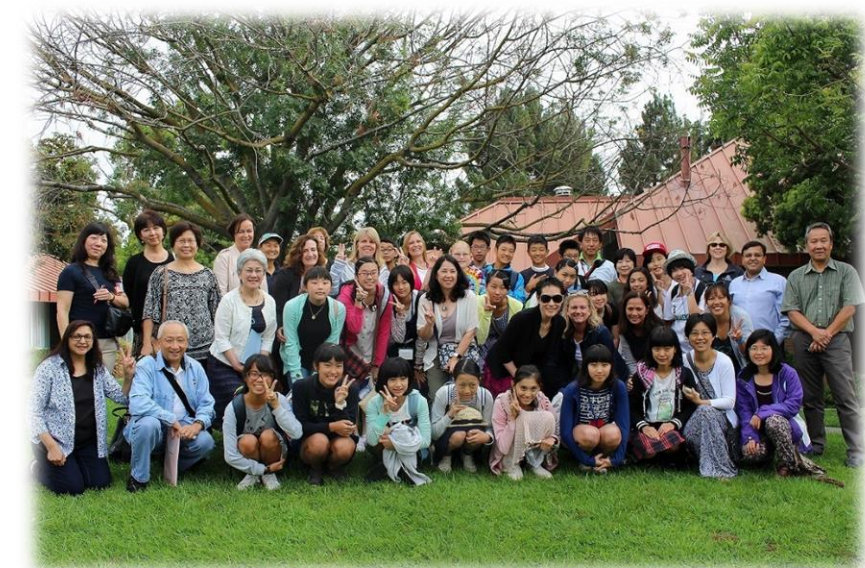
グローバル人材育成研修事業(米国サニーバール市)