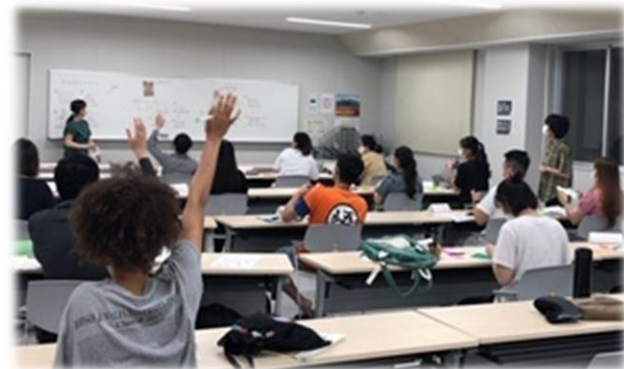
外国人のための日本語教室