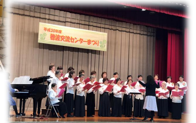
交流センターまつり