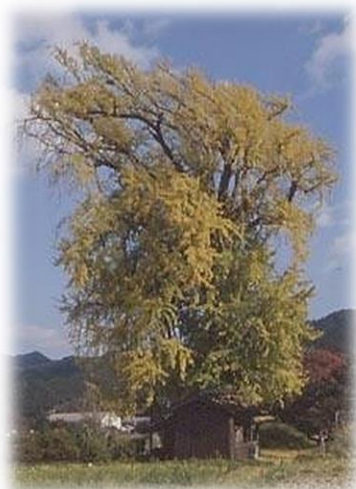
内野の大イチョウ(県指定天然記念物)