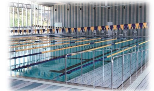
健幸の森公園市民プール

スポーツ施設の有効活用を進めるとともに、誰もが快適にスポーツを楽しむことができるよう、老朽化した施設については、統廃合等も視野に入れて改修等を図るなど環境整備に努めます。