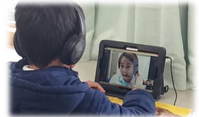
オンライン英会話の様子

また、豊かな心の育成を基盤として、小中一貫教育における異学年交流などを通じて幅広い人間関係育成能力や、実践的な英語力の育成や国際理解教育などを通じてグローバル社会で活躍できる人材の育成を図ります。