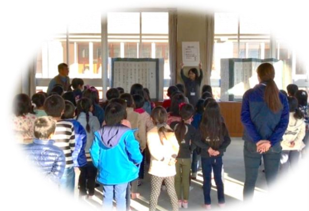
一体型の「放課後児童クラブ」 及び「放課後子ども教室」

ニートやひきこもり等社会生活を円滑に営む上での困難を有する子ども・若者に対する相談体制の充実を図るなど、国、県や関係機関と連携した支援を推進します。