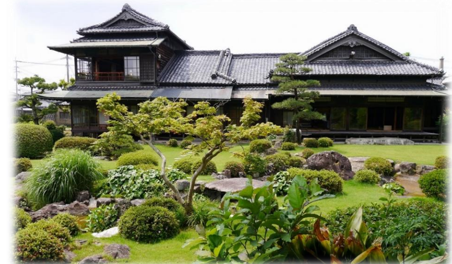
旧伊藤伝右衛門邸(国指定重要文化財、庭園は国の名勝指定)