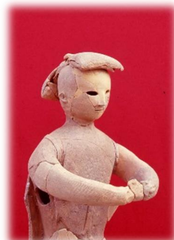
巫女形埴輪(小正西古墳出土 県指定有形文化財)