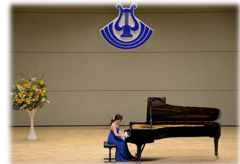
飯塚新人音楽コンクール

文化施設の整備や設備の改修等を行うとともに、適切な運営に努め、市民が安心して安全、快適に利用できるよう環境整備を進めます。