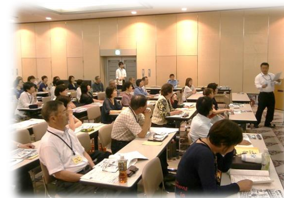
生涯学習事業(コスモス大学)

さらに、乳幼児から高齢者まで自由に、気軽に、楽しく利用でき、市民から愛され親しまれる施設づくりに努めます。