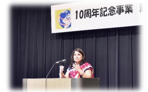
国際交流推進協議会 10周年記念事業

生活情報の提供や相談体制の充実など、在住外国人の支援に努め、外国人が安心して暮らせる住みよい環境づくりに努めます。