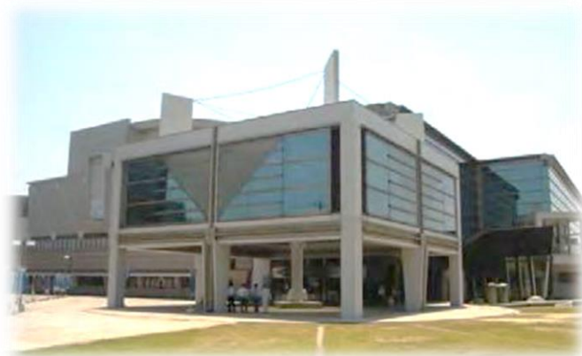
飯塚市文化会館(飯塚コスモスコモン)