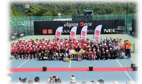
飯塚国際車いすテニス大会

競技スポーツ活動を実践している競技者、競技団体に対する支援を図るとともに、飯塚国際車いすテニス大会の開催支援に努めます。