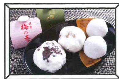
まんじゅう各種 80円(税込)