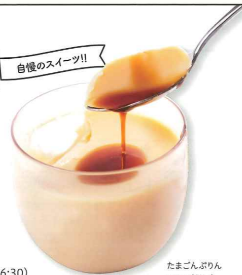
たまごんぷりん 199円(税込)

土産 飯塚市佐與1709-2 ☎09496-2-6844 営) 【販売】9:00~18:00 【カフェ】11:00~17:00 (o.s.16:30) 休) 販売: 年中無休、カフェ: 水曜日 駐) あり