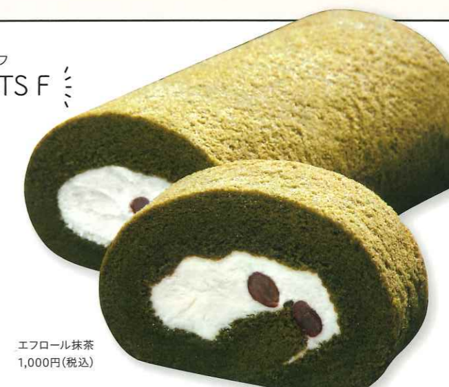
エフロール抹茶 1,000円(税込)

土産 嘉麻市上白井328-1 ☎0948-62-2848 営) 10:00~18:30 休) 水曜日 駐) あり