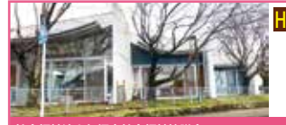
社会福祉法人飯塚市社会福祉協議会 筑穂支所 児童デイサービス ぴよぴよ

療育が必要なお子様に日常生活における基本的動作の支援、集団生活への適応支援等を行います。