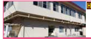
児童発達支援事業所 れいんぼう

※飯塚圏域の事業所・近隣の療育センターを紹介しています。 これ以外にも施設がありますので、お気軽にお尋ねください。