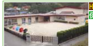
児童発達支援センター まどか園

児童福祉施設として定義づけられた児童発達支援センターであり、地域の障がいのある児童が通所して、日常生活における基本的動作の指導、自活に必要な知識や技能の付与または集団生活への適応のための訓練を受ける施設です。専門的機能を持ち地域における中核的な支援施設としての位置づけが重要視されています。