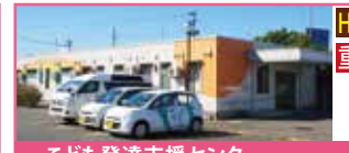
こども発達支援センター ミーティアス

視覚支援を用いた運動療育・学習支援・スキルトレーニング等を通し、一人ひとりの個性や強みを伸ばします。