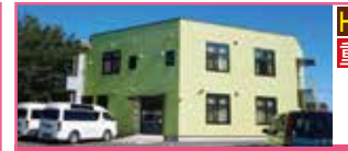
多機能型児童発達支援事業所 森の子

個々の発達に応じた能力向上を伴う療育内容で目標を立てスモールステップで育成できるよう支援しています。