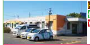
こども発達支援センター ミーティアス

こどもの森では、こども達が「自分の力を信じて頑張れる」よう日々考えながら療育に取り組んでいます。