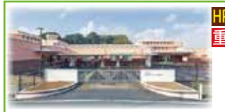
北九州市立総合療育センター 西部分所 きらきら通園

子どもたちの様々な問題に対して、生活の改善や将来の自立を目指して、個別や集団療育を実施しています。