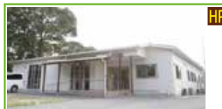
児童発達支援センター こどもの森

基本的な生活習慣の確立と言語や能力向上に向けた療育内容で個別のかつ集団的に支援しています。