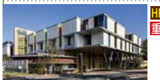
北九州市立総合療育センター にこにこ通園

北九州市小倉南区春ヶ丘10-4 093-922-5596 fax 093-952-2713