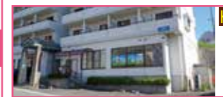
チャイルドハート 飯塚

重症心身障がい児の方へ、毎日を健やかに過ごせるように、医療、介護、保育、リハビリを積極的に提供します。