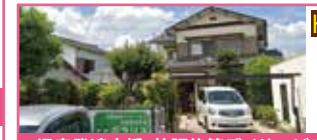
児童発達支援・放課後等デイサービス ボラリス

集団生活に適應できるように適切な訓練指導を行い、将来の就学や就労に向けた療育支援を行います。