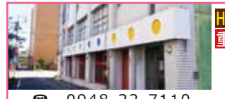
ほわいとういんぐ 飯塚館

作業療法士をはじめ医療教育の専門職が学習指導や手づくりの食事を提供してお子さんの自信とやる気を育みます。