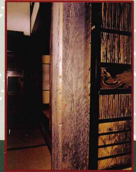
大黒柱のぎずあと