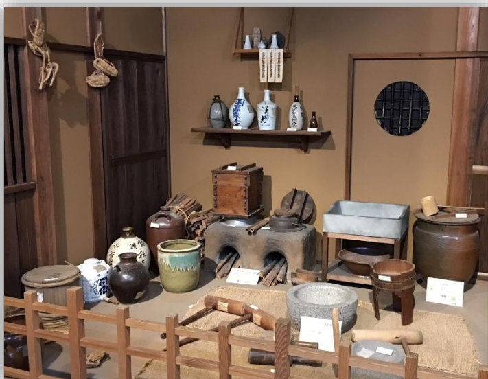
↑ 昔の生活道具(民具)