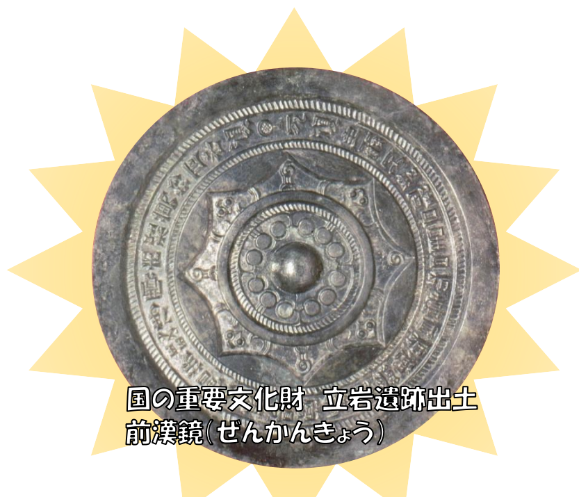
国の重要文化財 立岩遺跡出土 前漢鏡(ぜんかんきょう)

画面上にない 実物 を 見る 聴く 触れる 体験する 歴史資料館を活用した歴史・文化体験学習をご紹介します。