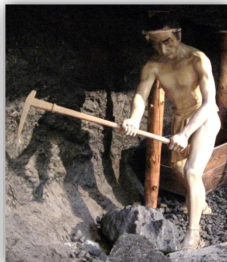
↑ 炭坑夫の模型 ← 国の重要文化財 立岩堀田遺跡の甕棺群 (かめかんぐん)