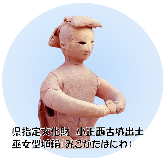
県指定文化財 小正西古墳出土 巫女型埴輪(みこがたはにわ)