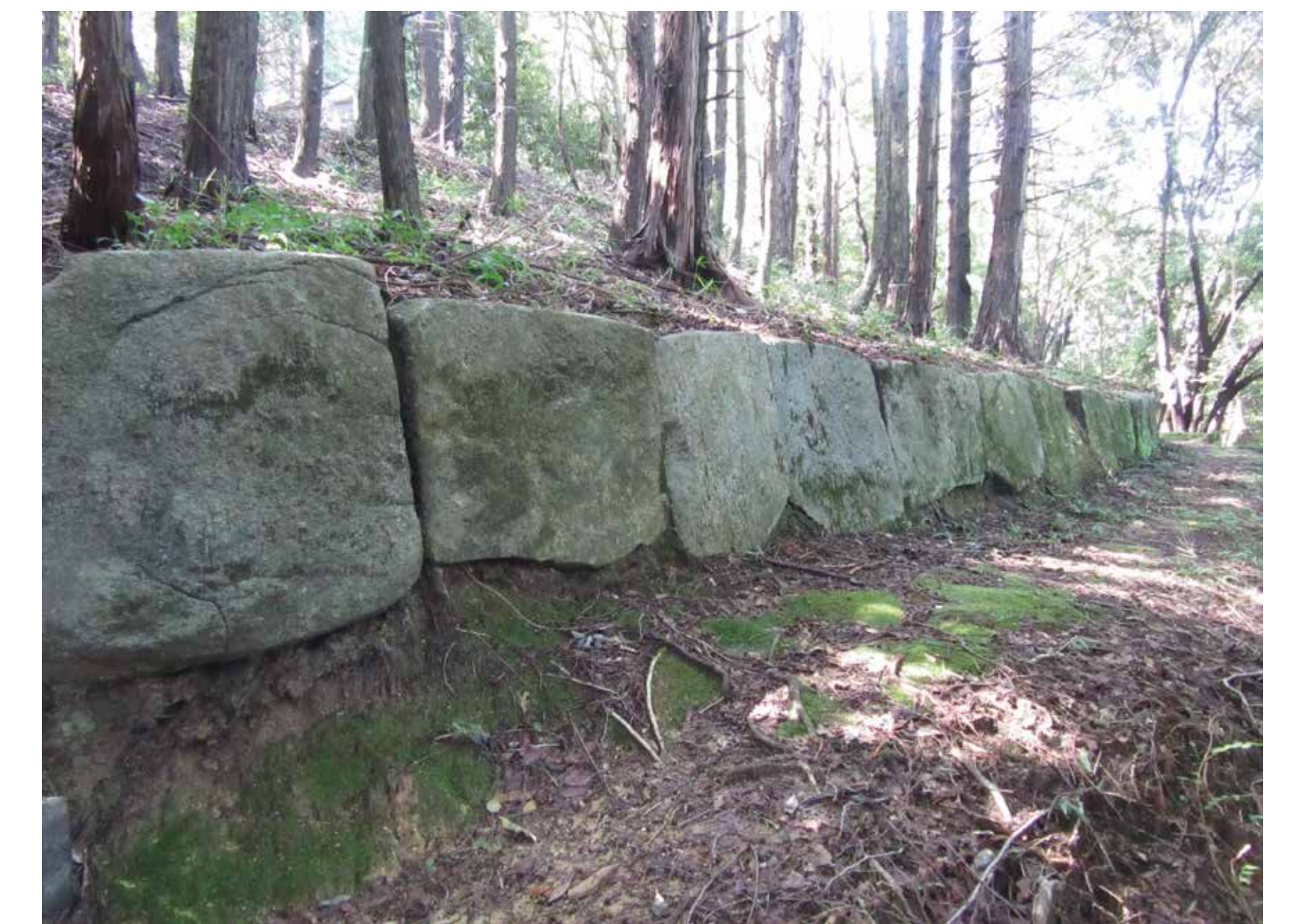
れっせき ③ 列石 土塁はなく列石(②)に比べ大きい石を並べています