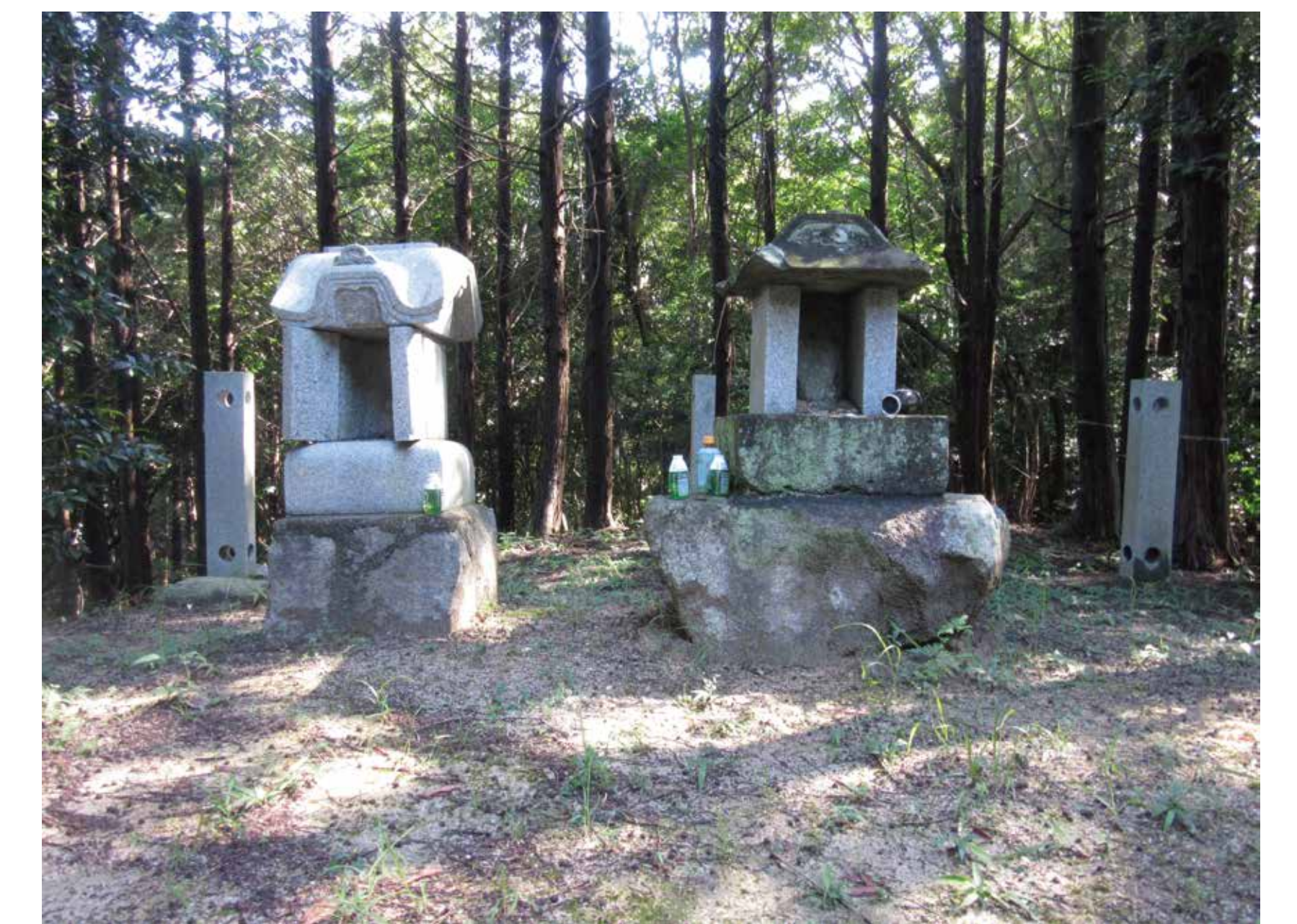
まきのじんじや ④ 牧野神社 現在は近くの厳島神社に相殿があります