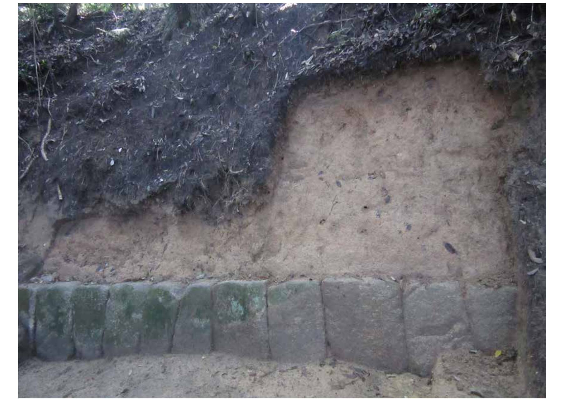
れっせき かこうがんせい どるい ② 列石(花崗岩製)・土塁