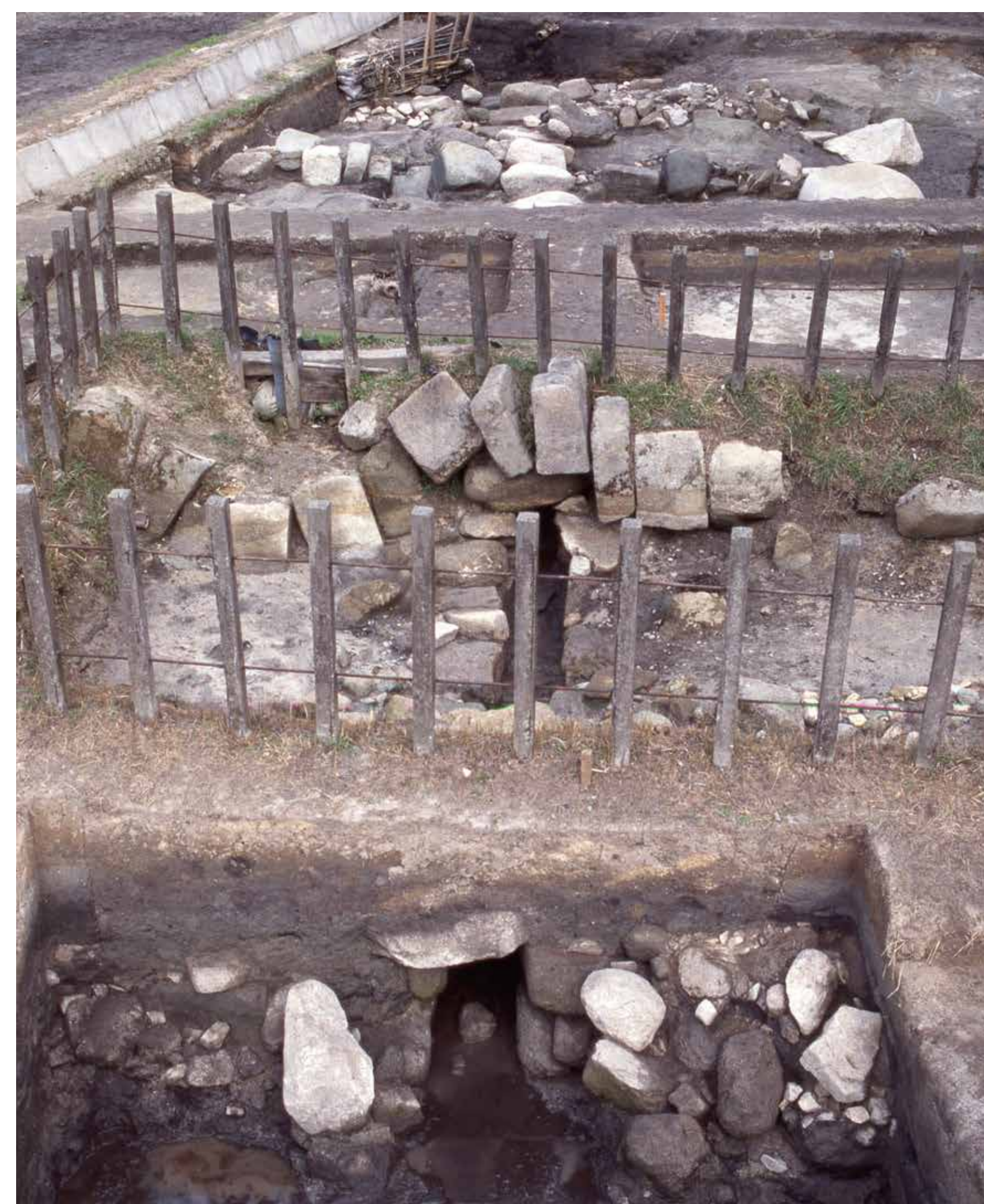
① 水門(第1暗渠) ※暗渠…地中に作った排水路