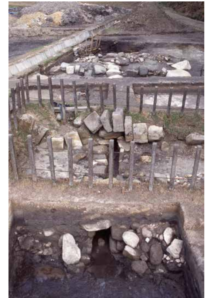
第1暗渠排水口（西から）