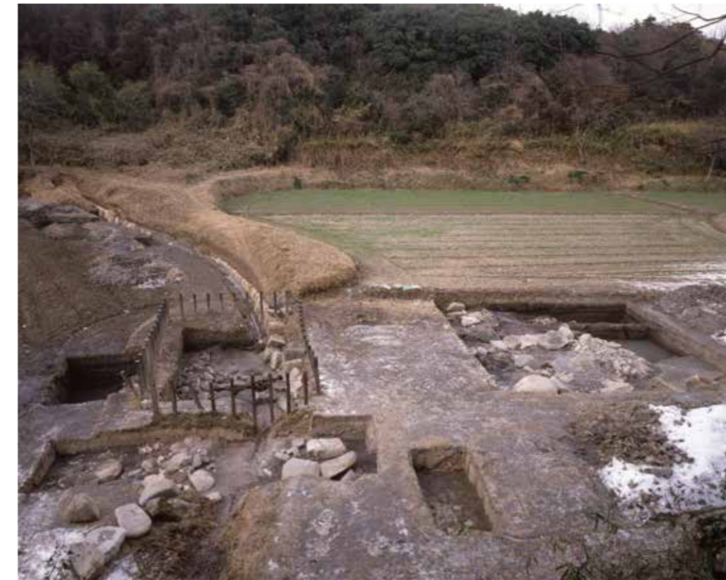
第1暗渠全景（南から）

第1暗渠は全長約18m、幅0.7~0.8mで取水口と排水口には約0.7mの高低差があります。取水口と排水口の周囲には多くの小石が積まれています。排水口から先は湿地に自然に排水していたと考えられます。