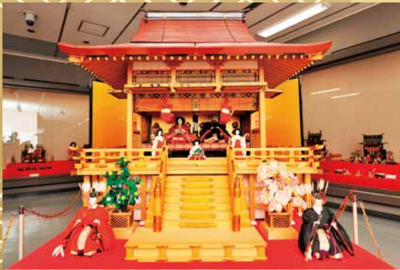
大木平蔵作「大御殿雛」

日本一小さな座敷雛が優美な美しさをも かもしだし、語り継がれた日本の物語の 奥深さを見る人々に伝えます。 館蔵の御殿雛なども展示します。