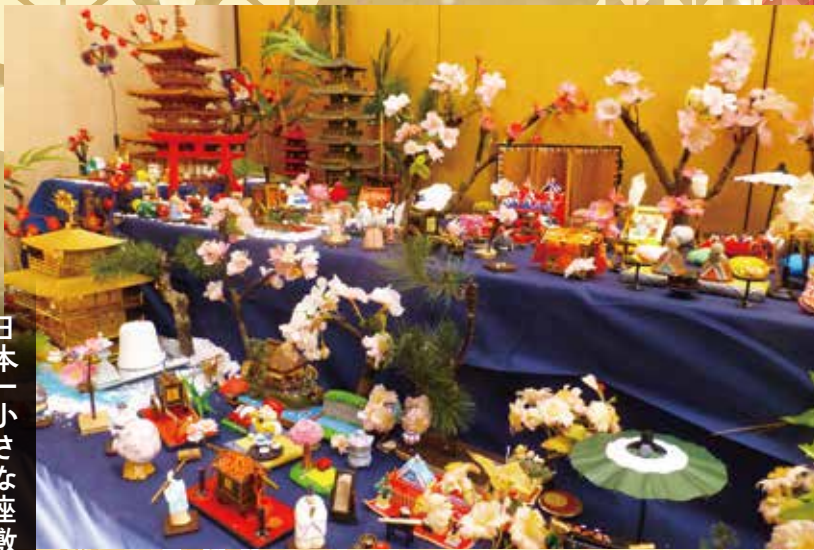
日本一小さな座敷雛