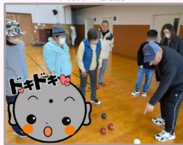
どっちのチーム が勝ったかな...

2月22日(土)に交流センターにて、健康・福祉部会主催の「にこにこスポーツ交流会」が開催されました。