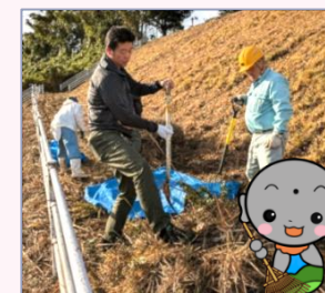
きれいになるように がんばるぞ！

今後は有効活用なども検討し、庄内の名所にできるように引き続き維持・管理に取り組んでいきます！