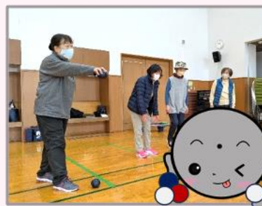
ゲームスタート！ 目指せ優勝！