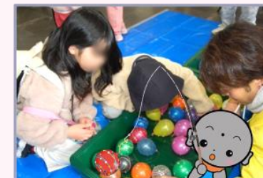
ヨーヨー釣りブース 上手に釣れるかなあ...