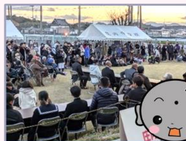
会場は来場者でいっぱい！