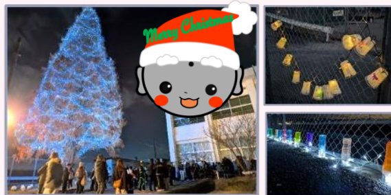
20mを超える大迫力のメタセコイア！ ほかにもたくさんライトアップされました！