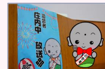
放送部の皆さんのおかげで スムーズに進行しました！

2月23日(日)、庄内交流センターにて「みんなのまちづくりフェスタ2025」が開催されました。司会進行は庄内中放送部の生徒さんたちをお願いしました。たくさんの来場者を前に少し緊張気味でしたが、部員6名みんなで力を合わせて最後まで務め上げていただきました。