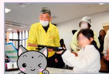
射的ブース よ〜く狙って... 一等賞の景品をゲットだ！