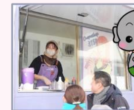
「クレープショップ3150」さん すごい行列ができてたね！

コロナ禍以降ハーモニーでは大規模なお祭りが開催されていませんでしたが、今回まちフェスが開催されたことがとても嬉しく思います。たくさんの方々に楽しんでいただき、庄内をもっと盛り上げていきたいという気持ちになりました。