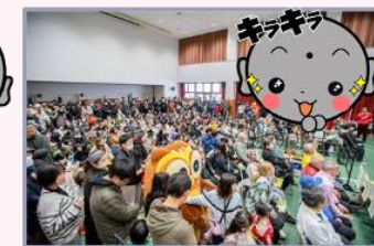
たくさんのご来場まことに ありがとうございました！