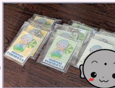
スタンプラリーの景品のキーホルダー なんと生徒さんの手作り！