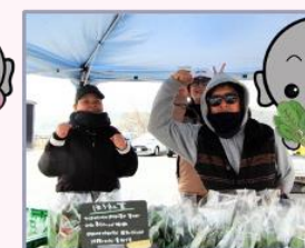
「ヤマオカサンチ」さん 新鮮な野菜がいっぱいだね！