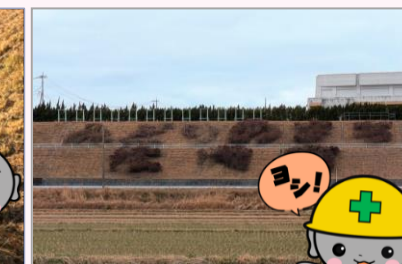
作業完了！ 文字が見えるね！