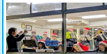
吹奏楽部による クリスマスドレーの演奏