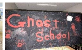
お化け屋敷で使用了看板。 工夫を凝らしたものに 仕上がっています!