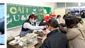
キッチンカーの様子(写真左 の2枚)と教室でのカフェの様 子(写真上)