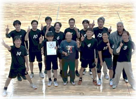
【オール鯉田キャットフィッシュ】