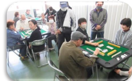
健康マージャン1・2

11月29日(土)飯塚片島交流センターにて、サークル発表会&マルシェが開催されました。 サークル生さんの普段見る事が出来ない発表を見せていただき、楽しいひと時となりました。【開会式・はじめの言葉】 その時の様子を紹介します。