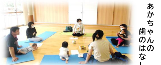
あかちゃんのはなし