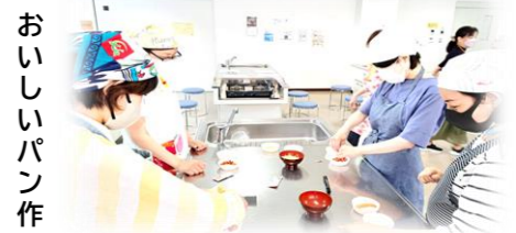
おいしいパン作り