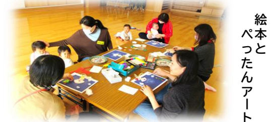
絵本とたんアート