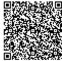
片島児童センター地図