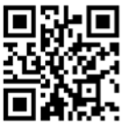
飯塚地域雇用創造協議会 HP