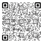
飯塚神功女神輿フェイスブック