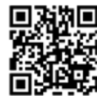
ビックリ発明ランド専用HP