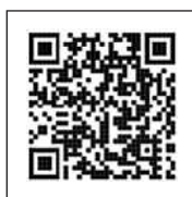
マイナポータル 連携特設ページ