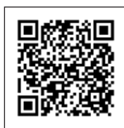
マイナポータル連携 事前設定ページ