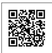
新・BS日本のうた ホームページ

※応募者多数の場合は抽選 問 飯塚コスモスコモン (☎0948・21・0505)