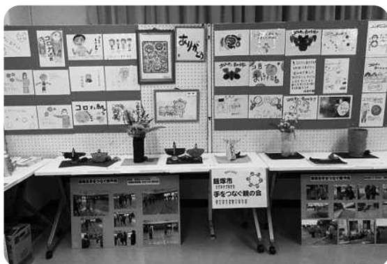
▲昨年の展示の様子