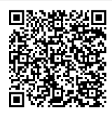
AIチャットボットの 利用について

飯塚市公式LINEアカウントの友だち登録は、下のQRコードを読み込むか、「@iizuka_city」でID検索してください。