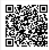
LINE友だち登録QRコード