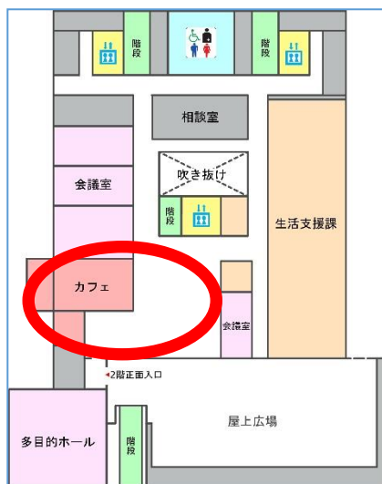
新庁舎 2 階