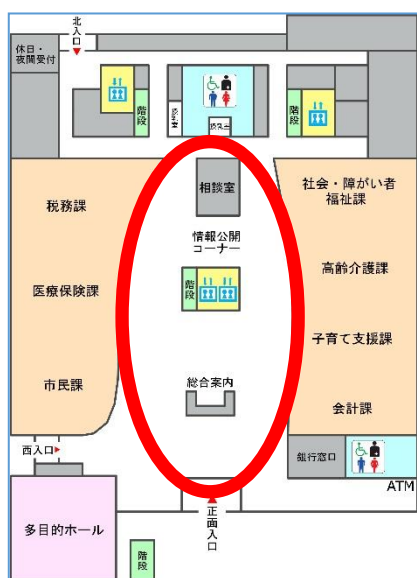
新庁舎 1 階