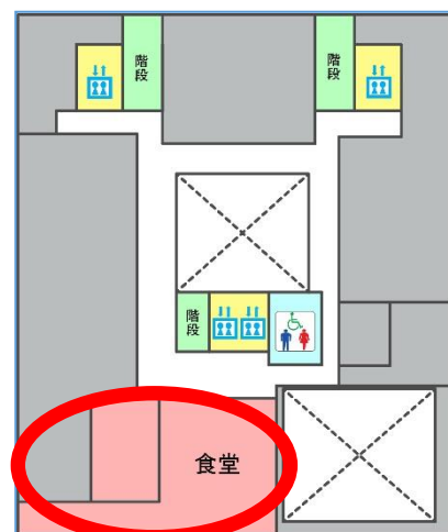
新庁舎 8 階