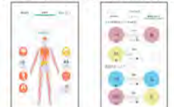
健康支援サービス (MIRAMED) 株式会社日立システムズ