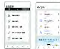
SaluDi 沢井製薬株式会社