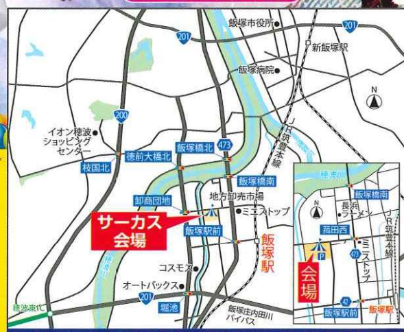
サーカス会場案内図