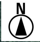
別紙 2 航空図